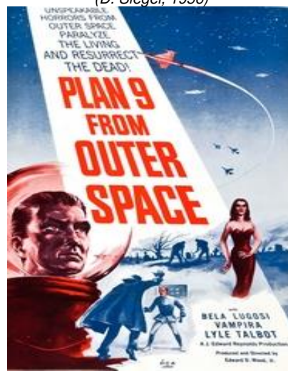
Plan 9 from Outer Space (E. Wood, 1959)