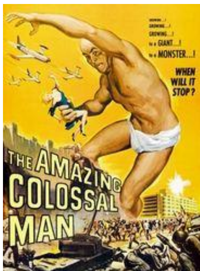
Le fantastique homme colosse (B. I. Gordon, 1957)