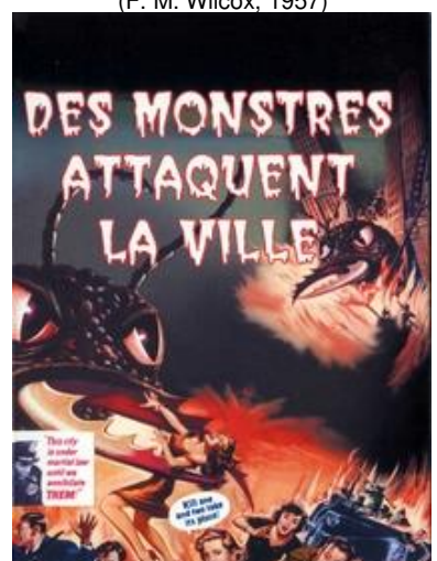
Des monstres attaquent la ville (G. Douglas, 1954)