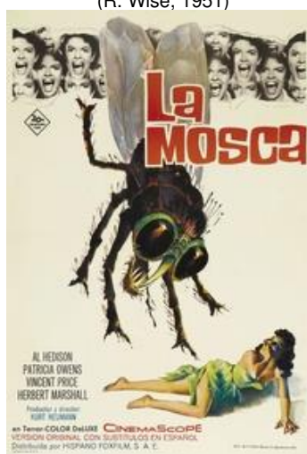
La Mouche Noire (K. Neumann, 1958)