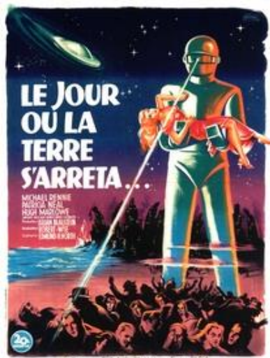
Le jour où la Terre s'arrêta (R. Wise, 1951)