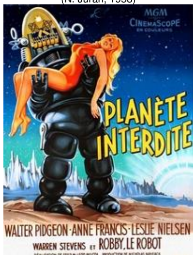
Planète interdite (F. M. Wilcox, 1957)