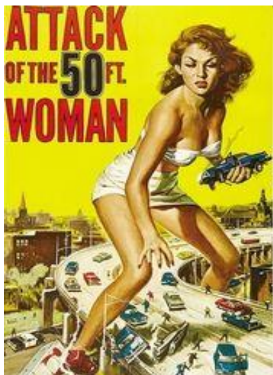
L'attaque de la femme de 50 pieds (N. Juran, 1958)