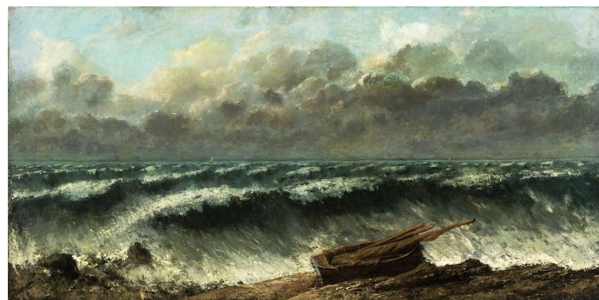
Courbe, La vague, 1869