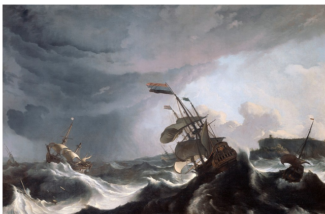
Backhuysen, Navires de guerre dans une tempête, 1708