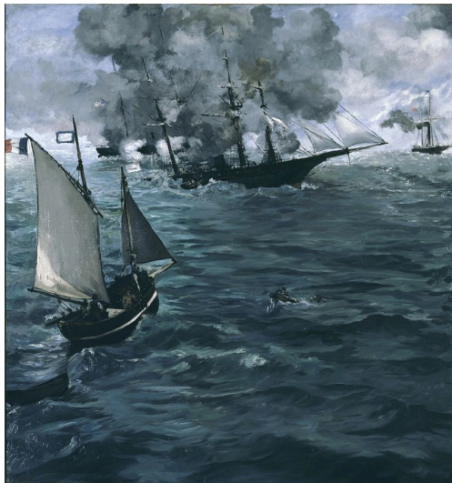
Turner, Coucher de soleil écarlate, vers 1830