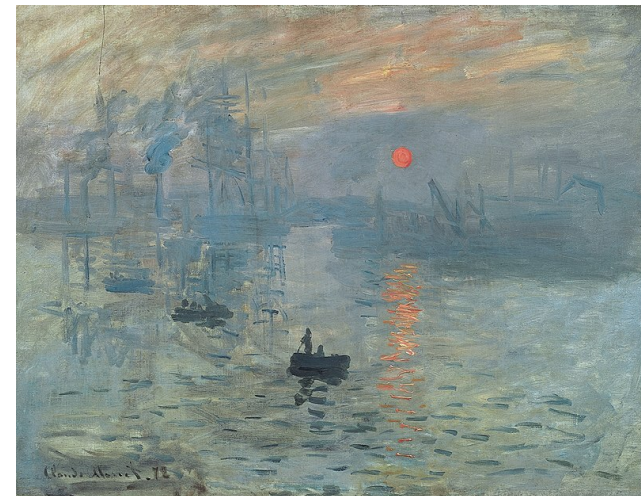
Monet, Impression soleil levant, 1872