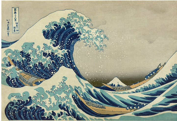
Hokusai, La grande vague de Kanagawa, 1850