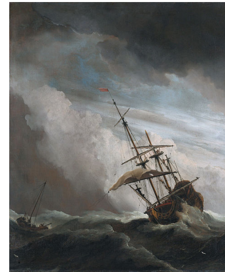
Van de Velde, The Gust, 1680