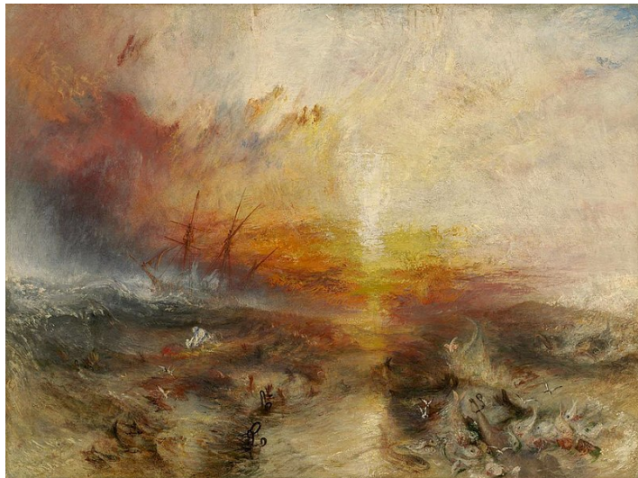
Turner, Le négrier, 1840