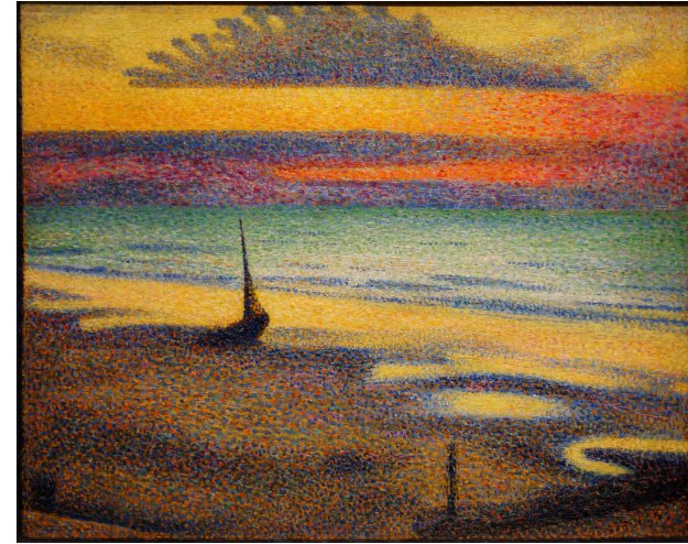
Lemmen, Plage à Heist, 1891