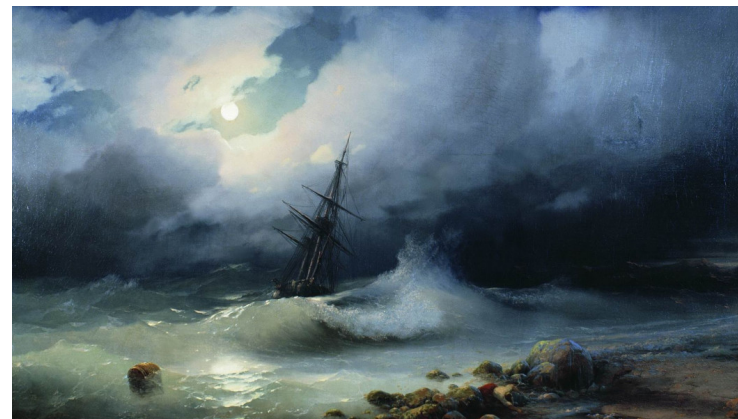
Aivazovsky, Tempête en mer la nuit