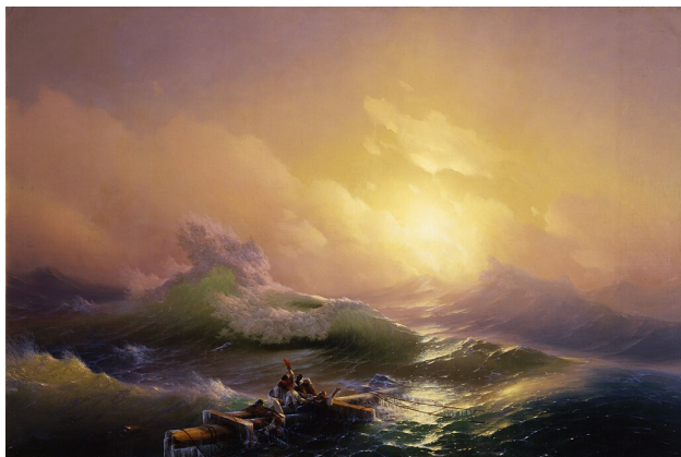
Aivazovsky, La neuvième vague, 1850