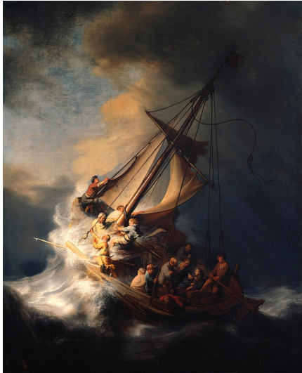
Rembrandt, La tempête sur la mer de Galilée, 1663